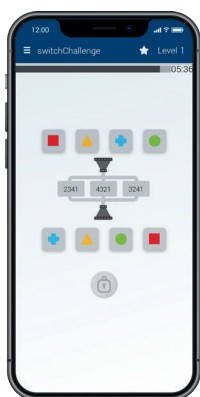
switchChallenge misst das logische Denken