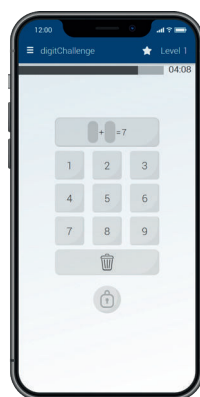
digitChallenge misst die Rechenfertigkeit